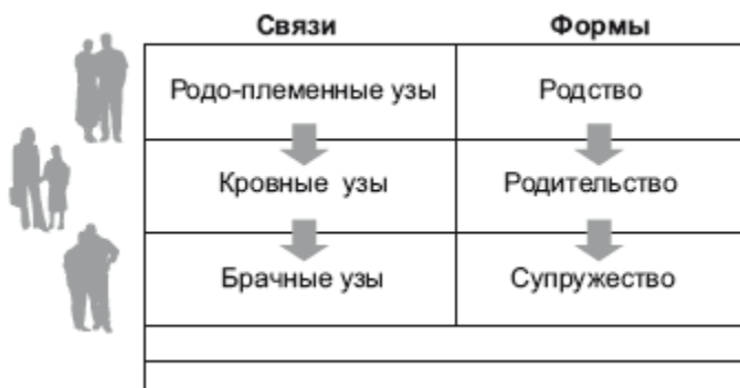
Рис. 1.1. Трансформация

С психологической и этнографической точки зрения для семьи системообразующими являются брачно-семейные отношения.