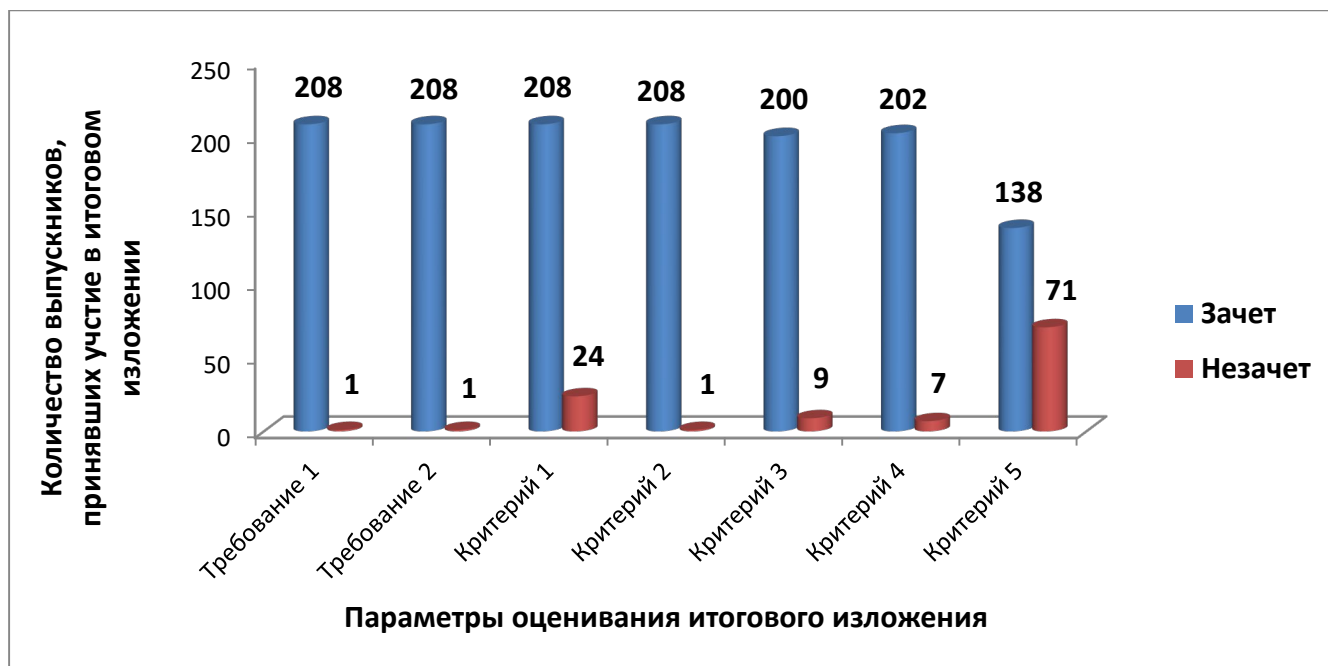
Рисунок 2 – Результаты проверки итогового изложения за 2022-2023 учебный год.

Обобщенные результаты проверки итогового изложения по критериям в Приморском крае в 2022–2023 учебном году в трех турах представлены на рисунке 2.