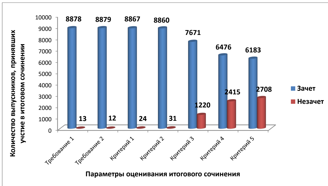
Рисунок 1 – Результаты проверки итогового сочинения за 2022-2023 учебный год.

Обобщенные результаты проверки итогового сочинения по критериям в Приморском крае в 2022–2023 учебном году в трех турах представлены на рисунке 1.