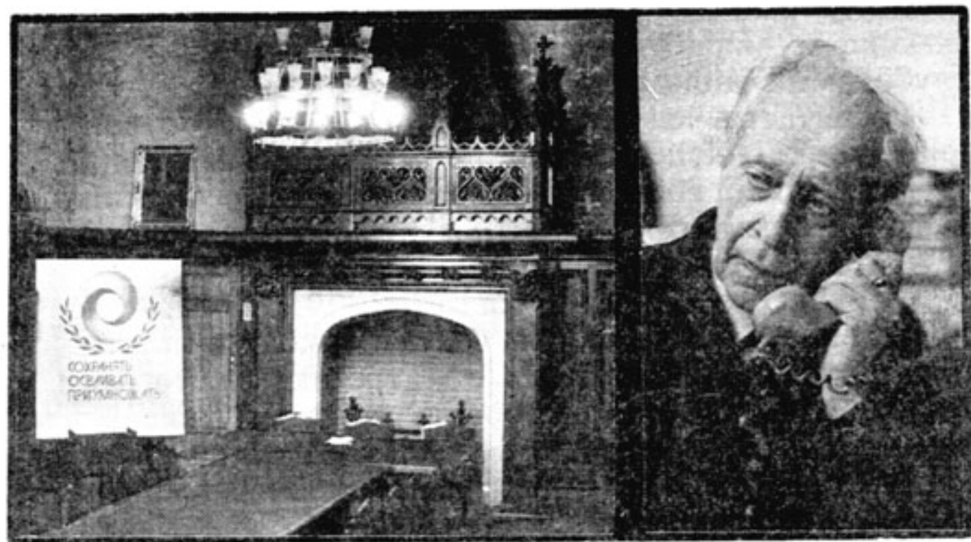
Зал заседаний Советского Фонда культуры