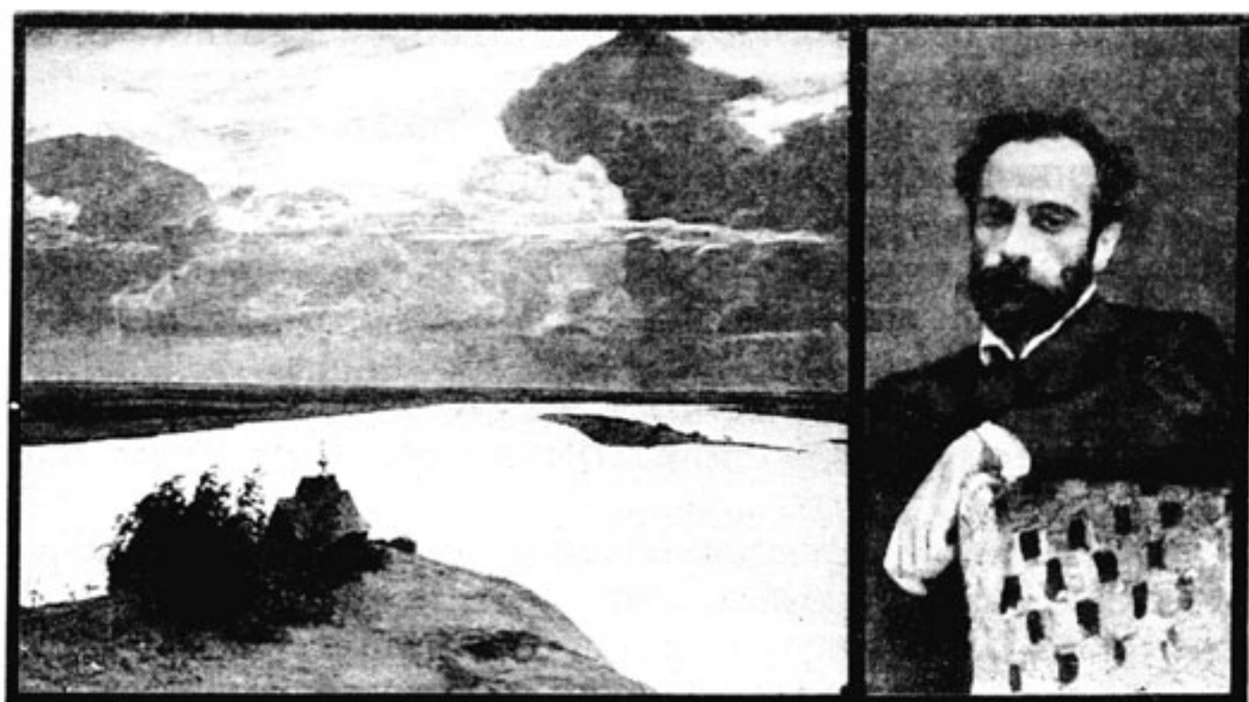
Над вечным покоем. Картина И. Левитана