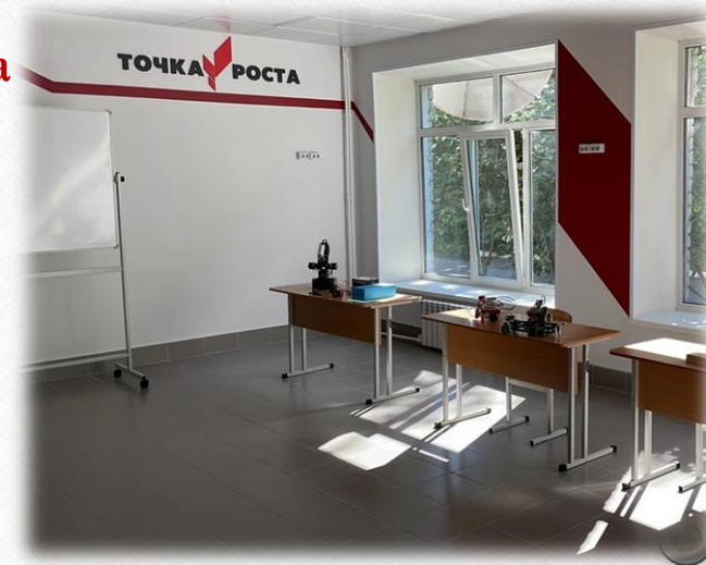
Наличие цифрового современного оборудования