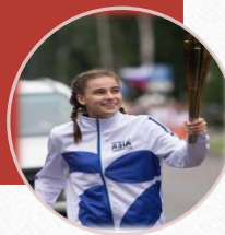
Участница эстафеты огня «Дети Азии» - 2022г.