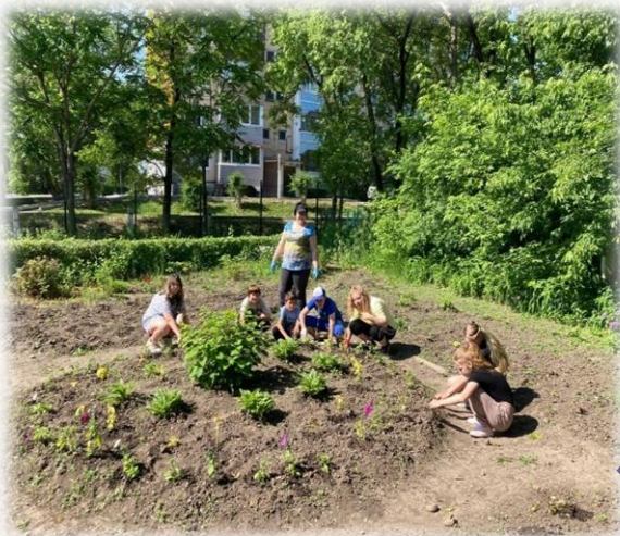
Факультативный курс «Тракторист-машинист»

Опыт реализации модуля «Сельскохозяйственный труд» (Технология), организации работы на пришкольном участке