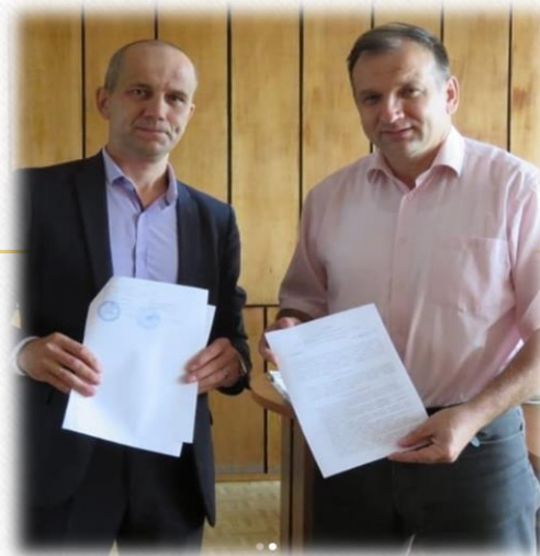
Опыт сотрудничества с учреждениями СПО и ВПО