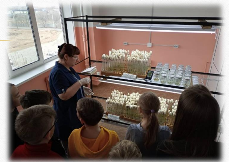
Использование лабораторий института при преподавании химии и биологии