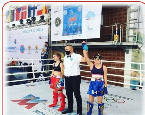
Победитель первенства Европы по кикбоксингу – 2021г.