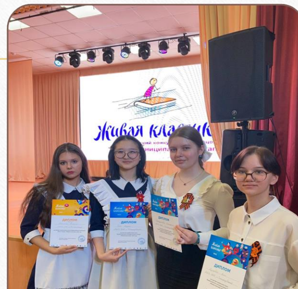
Победители и призеры II краевой научно-практической конференции молодежи «Культурно-историческое и православное наследие: образование, наука, общество» - 2022