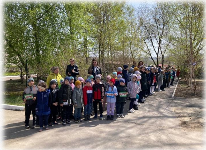
Открытие Аллеи памяти