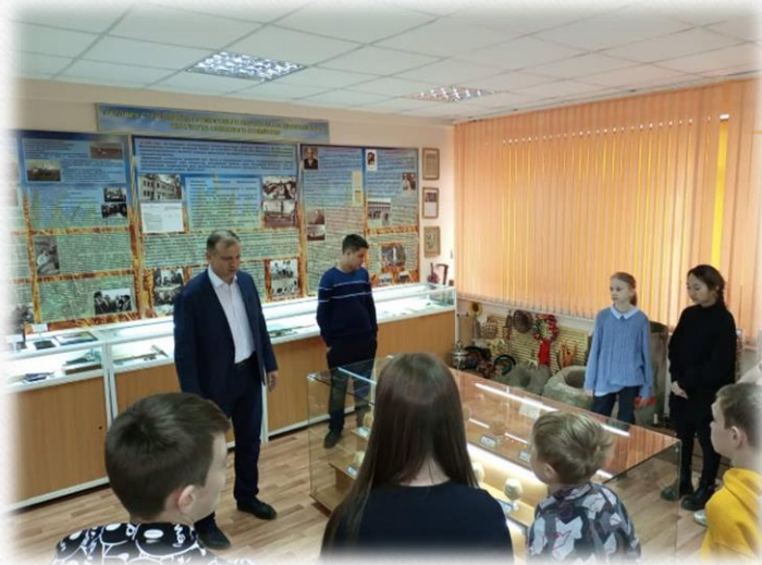
Экскурсии учащихся в музей истории института