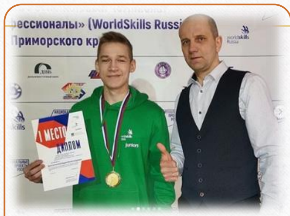
WORLD SKILLS RUSSIA-2022