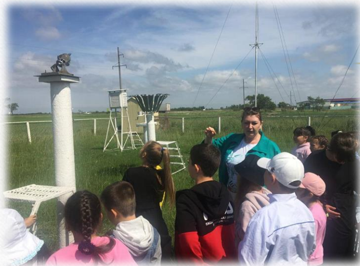
Экскурсии учащихся 1-7 классов на метеостанцию

Проведение уроков «Окружающий мир» с использованием оборудования метеостанции