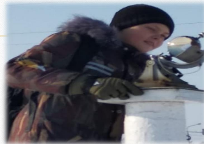
Организация проектной и исследовательской деятельности школьников