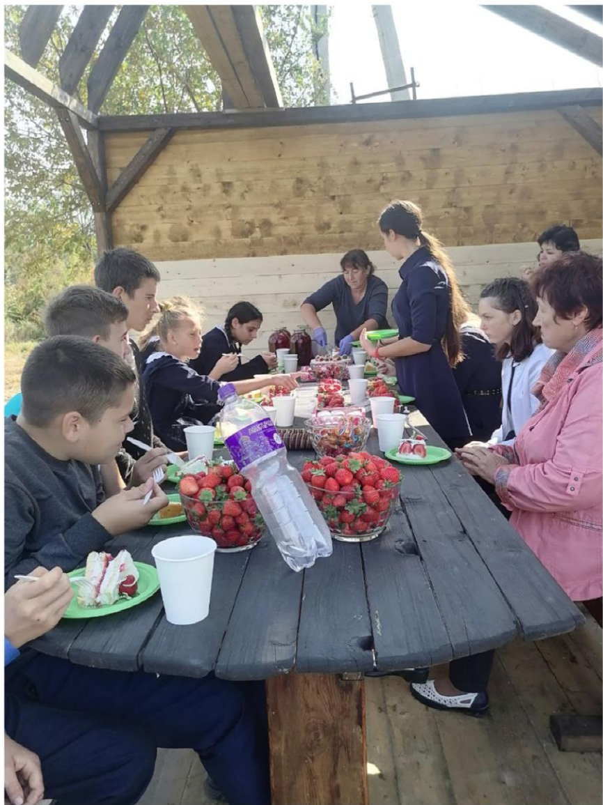
Дегустация ароматной клубники разных сортов и сладкой клубничной продукции